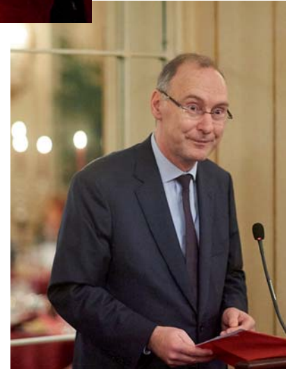
S. E. l'Ambassadeur Ch. Meuwly

Les similitudes entre la Suisse et la Belgique sont nombreuses : la taille, le multilinguisme, avec, pour les francophones, une langue majoritaire qui est celle du voisin du nord, quatre pays voisins, la présence de villes comme Bruxelles et Genève qui abritent un très grand nombre